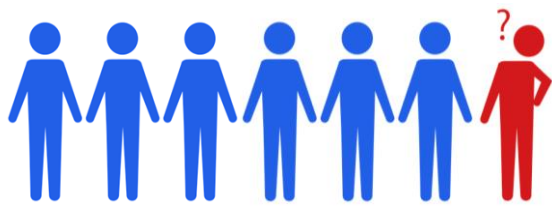
高齢者の7人に1人が認知症